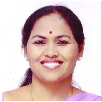
ಶೋಭಾ ಕರಂದಾಜೆ ಬಿಜಿಪಿ ಅಭ್ಯರ್ಥಿ

ಉಡುಪಿ ಚಿಕ್ಕಮಗಳೂರು ಕ್ಷೇತ್ರದಲ್ಲಿ ಶೋಭಾ ಕರಂದಾಜೆ ಬಿಜಿಪಿ ಅಭ್ಯರ್ಥಿಯಾಗುವುದು ಬಹುತೇಕ ಖಚಿತವಾಗಿದೆ. ಜಯಪ್ರಕಾಶ್ ಹೆಗ್ಡೆಯವರ ಪರವಾಗಿ ಸಾಕಷ್ಟು ಮಂದಿ ಪಕ್ಕದ ಉನ್ನತ ಮಟ್ಟದಲ್ಲಿ ಪ್ರಯತ್ನ ನಡೆಸಿದರೂ ಹಾಲಿ ಸದಸ್ಯೆ ಎಂಬ