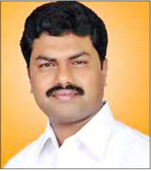
ಬಿ.ವೈ. ರಾಘವೇಂದ್ರ ಬಿಜಿಪಿ ಅಭ್ಯರ್ಥಿ

ಲೋಕಸಭಾ ಚುನಾವಣೆಗೆ ಅಭ್ಯರ್ಥಿಗಳ ಆಯ್ಕೆ ಅಂತಿಮಗೊಳ್ಳುತ್ತಿದ್ದು ಶಿವಮೊಗ್ಗ ಬೈಂದೂರು ಕ್ಷೇತ್ರದಲ್ಲಿ ಬಿಜಿಪಿಯಿಂದ ಬಿ.ವೈ.ರಾಘವೇಂದ್ರ ಹಾಗೂ ಮೈತ್ರಿ ಅಭ್ಯರ್ಥಿಯಾಗಿ ಚಿಡಿಎಸ್‌ನಿಂದ