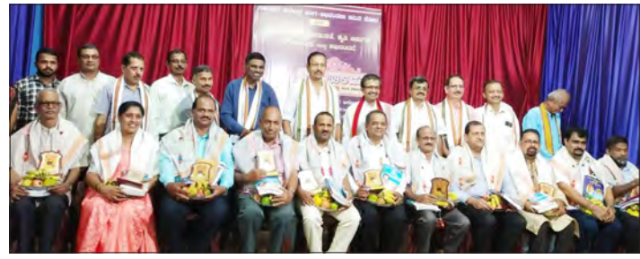
ಭಾವಬಿಂದು ಕಾರ್ಯಕ್ರಮದಲ್ಲಿ ಶಿಕ್ಷಕರು , ಸಾಹಿತಿಗಳು , ಕವಿಗಳು ಹಾಗೂ ಗಣ್ಯರನ್ನು ಸನ್ಮಾನಿಸಿ ಗೌರವಿಸಲಾಯಿತು.